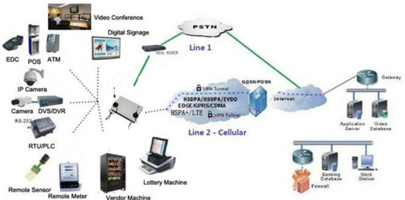
Single H820 Typical Application Diagram