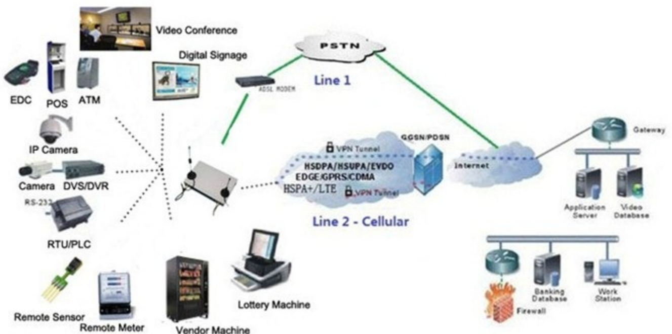
Single H820 Typical Application Diagram