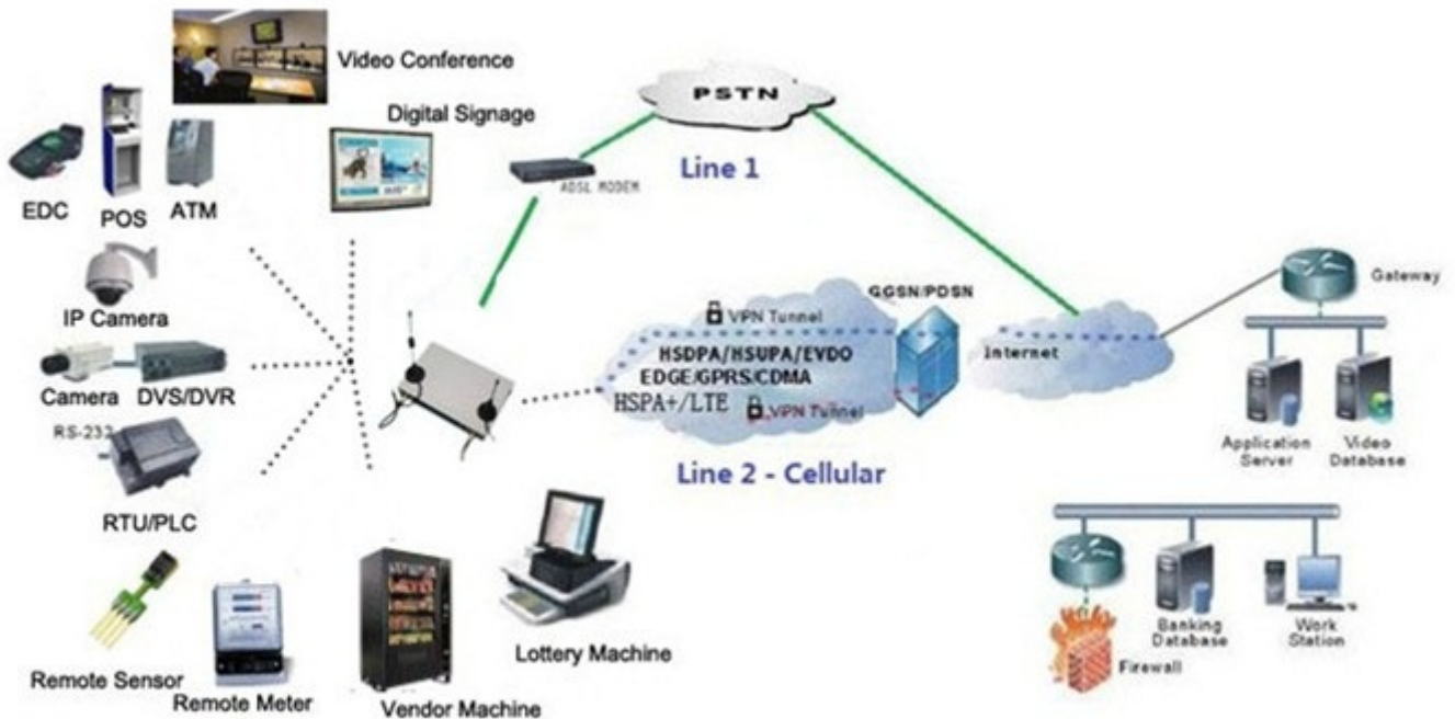
Single H820 Typical Application Diagram